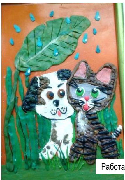
Работа Полины Поздеевой