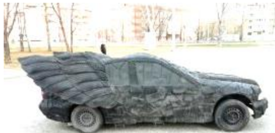
Арт-объект перед музеем современного искусства