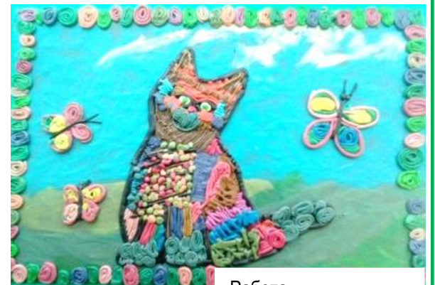
Работа Евгения Шаламова