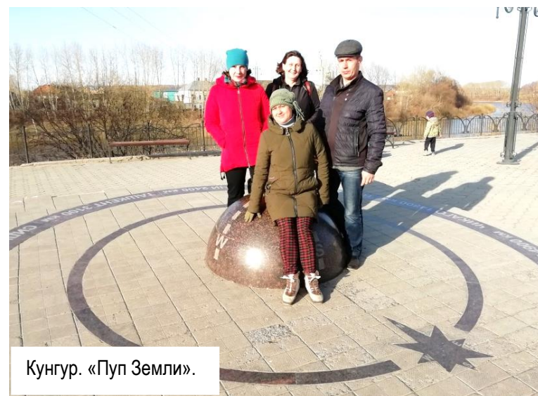
Кунгур. «Пуп Земли».

Раннее утро, Кама, солнце, набережная. И вдруг – робкий голос соловья!!! Вот он, серый, невзрачный, но такой талантливый птах, в нескольких метрах на ветке березы с чуть распусившимися листочками. Разве не чудо?