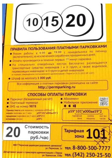
Инструкция на парковке